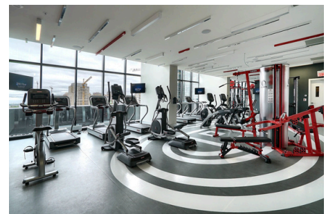
Salle de sport

Plongez dans le confort et la tranquillité, entouré d'un design raffiné et d'une ambiance apaisante.