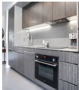
Cuisine moderne équipée

Une cuisine entièrement équipée, pensée pour allier confort et convivialité.