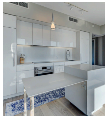
Cuisine moderne équipée

Une cuisine entièrement équipée, pensée pour allier confort et convivialité.