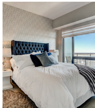
Deux chambres modernes

Une cuisine entièrement équipée, pensée pour allier confort et convivialité.