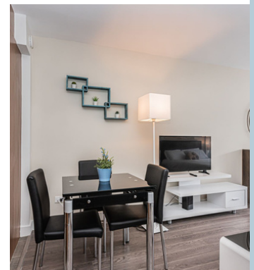
Refined Dining Room

A private haven with a warm atmosphere and inviting décor.